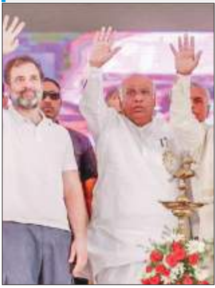
कर्नाटक विधानसभा चुनाव से 24 दिन पहले कांग्रेस नेता राहुल गांधी ने कोलार में जनसभा को संबोधित किया।